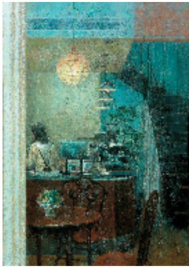
于帆 岁月静好 170x120cm

陆庆龙在点评中对本次展览给予充分肯定。他表示,此次展出作品体现时代、贴近生活,形式多样、语言丰富,特别是体现出画种融合、