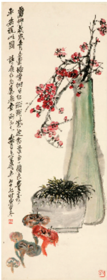
吴昌硕 瓶梅芝蒲 106x40.2cm 中国画 1920年 中国美术馆藏

本次展览展出吴昌硕所书的《石鼓文》横幅和扇面、唱和题诗等书画真迹,以及《汉三老讳字忌日碑》、雷峰塔《华严经》残石等珍贵文物的拓片,部分展品为首次对外公开展示。展览分为“尊其癖嗜”“金石之交”“四艺融通”等三个章节,展出浙江图书馆所藏与吴昌硕相关的近25件历史文献。其中第一章“尊其癖嗜”,以历代《石鼓文》拓片及吴昌硕临创《石鼓文》系列书法为脉络,领略其与《石