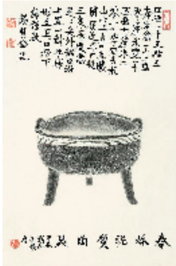
鲍贤伦 题春秋泥质陶鼎图 42x29cm 2024年