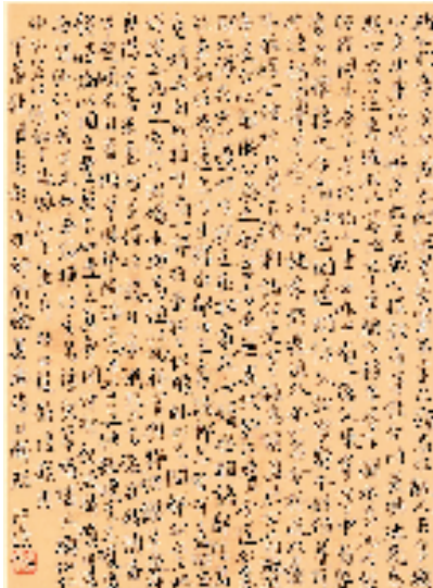
郑奇平 世说新语系列 33x26cm 2024年

本报讯 林晓峰 赵凯怡 12月17日，由衢州市委宣传部指导，衢州市文联、衢州市文旅局主办的“南山万叠——鲍贤伦、郑奇平书法展”在衢州美术馆开展，共展出鲍贤伦、郑奇平作品100件， 浙江省书协名誉主席、浙江省文史研究馆馆员鲍贤伦是当代书法大家，书艺精湛、学养丰厚，其作品浑厚灵动。衢州市文联原主席、浙江省书法研究会副主席郑奇平的作品笔墨清新、富有个性。现场，两位作者向衢州市文旅局捐赠书法作品。