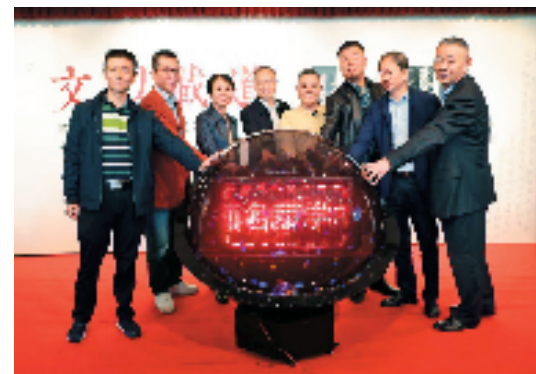
启动展览开幕仪式