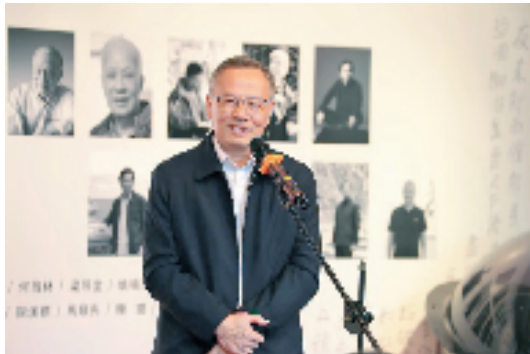
广东省政府参事室(文史馆)原副主任(副馆长)、一级巡视员陈小敏致辞