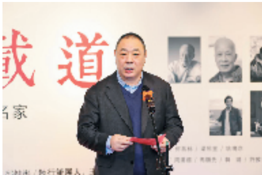
广州画院院长、广东省美协副主席宋陆京致辞