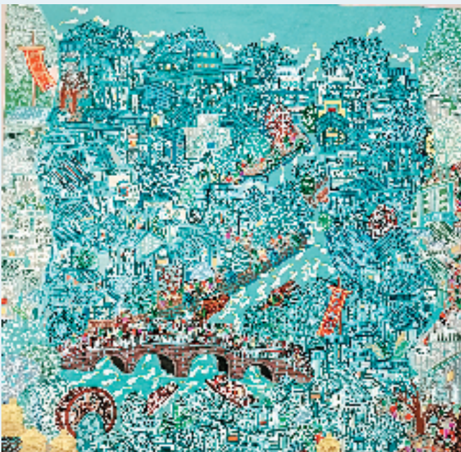
陈双才 生态家园 120x150cm 综合画种 (入选第十四届全国美展)