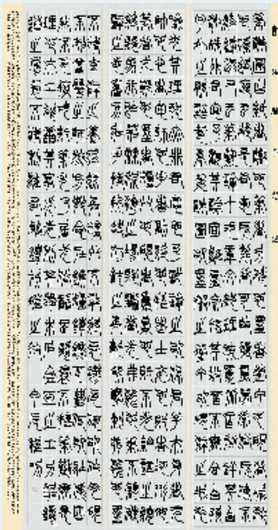
程功 《书法雅言》选抄 28x129cm (入展全国第十三届书法篆刻展)