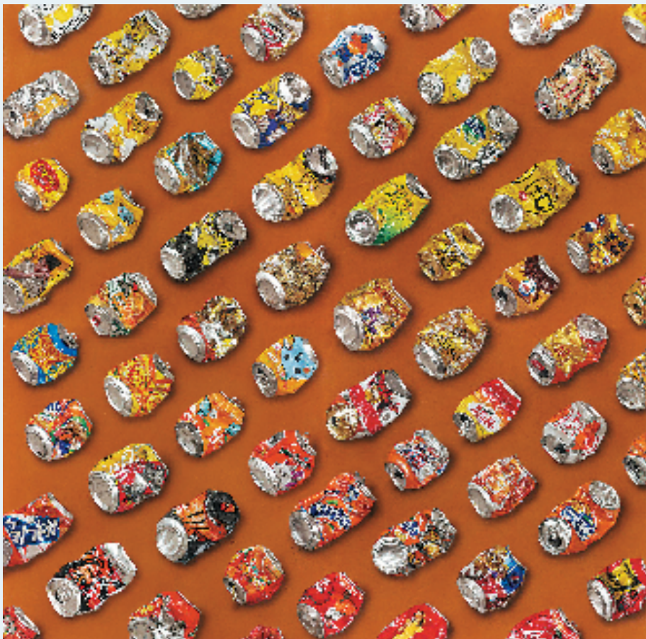
郑浙明 易拉罐之橙 168x168cm 水彩、粉画