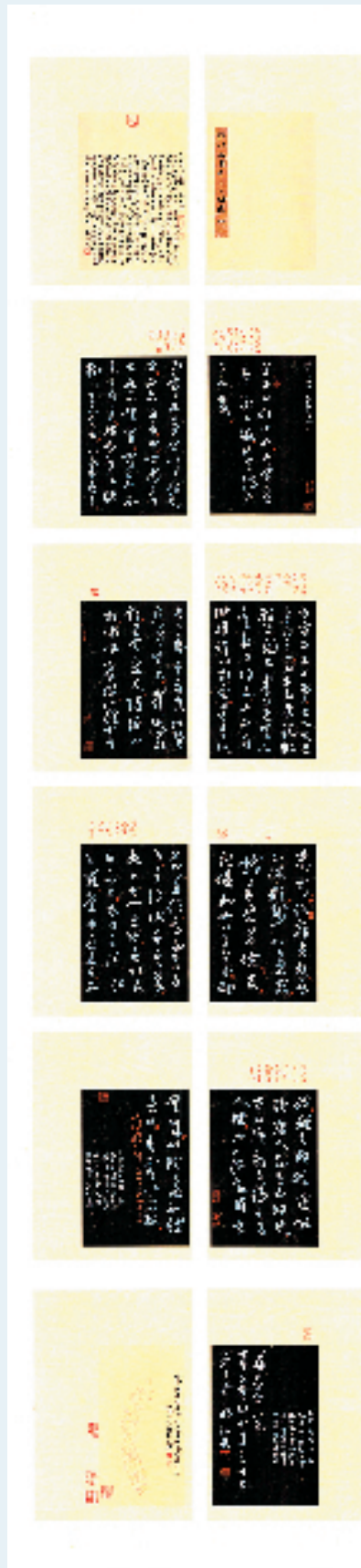
郭裕文 草书《李太白碑阴记》32x240cm (入展全国第十三届书法篆刻作品展览进京展)