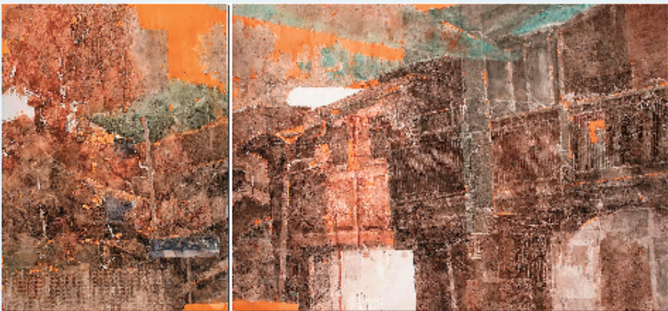
郑荣林 轻风煮酒 30x15cm 水彩、粉画

今年5月，全国第十三届书法篆刻展览进京展在中国美术馆开展。衢州市青年书法家郭裕文凭借草书作品《李太白碑阴记》成功入选，成为衢州市唯一一位参展作者。郭裕文是一位少校军转干部，结束军旅生涯后的他便转业落户在衢州，这里也是郭裕文妻子的家乡，回到衢州后，他便一直致力于书法文化的推广和传播。他身体力行，积极组织书法笔会、公益讲座和艺术沙龙，以艺术志愿服务的形式回馈社会，让更多的人了解和热爱书法。在郭裕文看来，书法不仅仅是一种艺术形式，更是一种精神寄托和文化传承。他希望通过自己的努力，能够激发更多人对书法的兴趣和热情。同时，他也一直在思考如何将书法艺术融到国防教育事业的建设和发展中，让书法成为连接军民情感的桥梁，为国防事业注入更多的文化元素和精神动力。