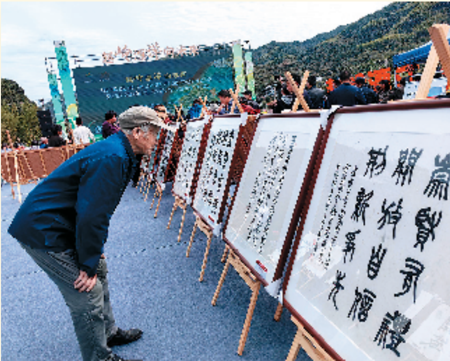
新时代衢州人文精神专题作品巡展