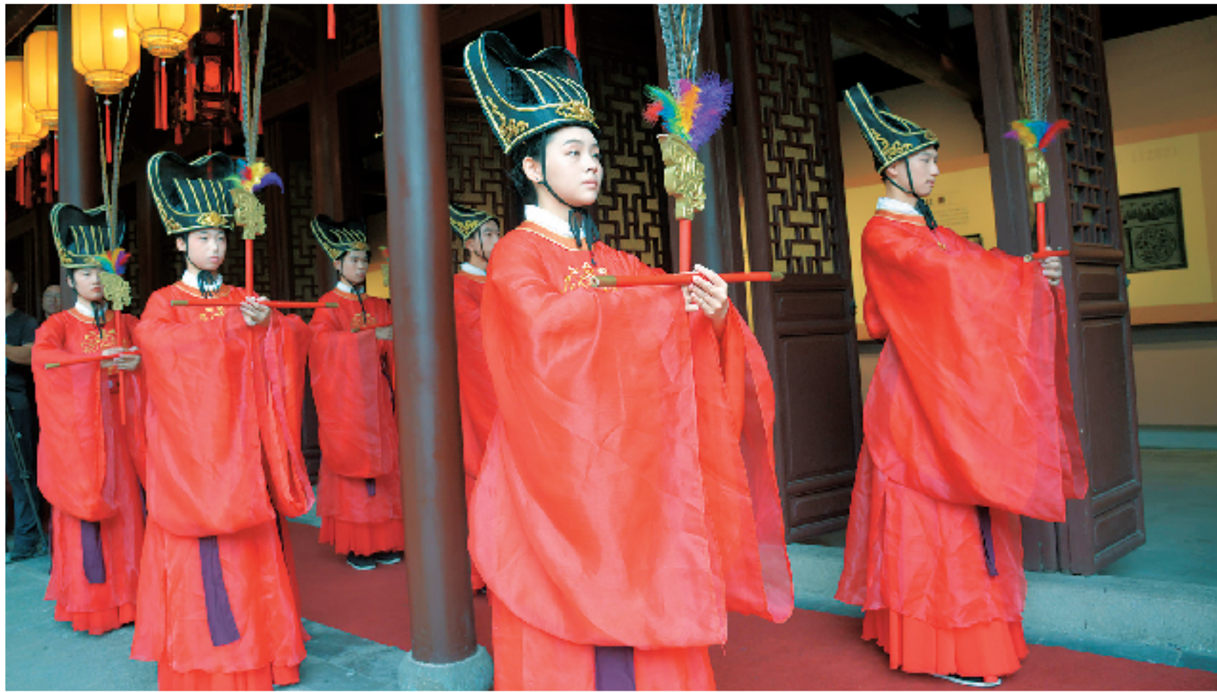
孔子诞辰2575年祭祀典礼在衢州孔氏南宗家庙举行

在浙西的青山绿水间，衢州这座拥有千年历史的古城正以一种全新的姿态展现在世人面前。“崇贤有礼、开放自信、创新争先”的新时代衢州人文精神，传承着深厚的儒家文化底蕴，更在创新与融合中焕发新生；乡村美育之路，让原本沉寂的乡土文化重新焕发生机。讲堂里，知名学者与文化名人轮番登场，为市民带来精神食粮；美术馆中，一幅幅精美的作品诉说着时代的故事，让人流连忘返……这些新名片向世界展示着衢州的独特魅力。如今，衢州已经形成了独具特色的文化品牌，吸引了越来越多的目光聚焦于此。