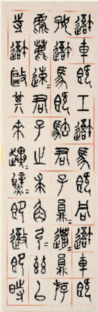
吴昌硕 临石鼓文四条屏 1.33×39cm×4 1890年 西泠印社藏