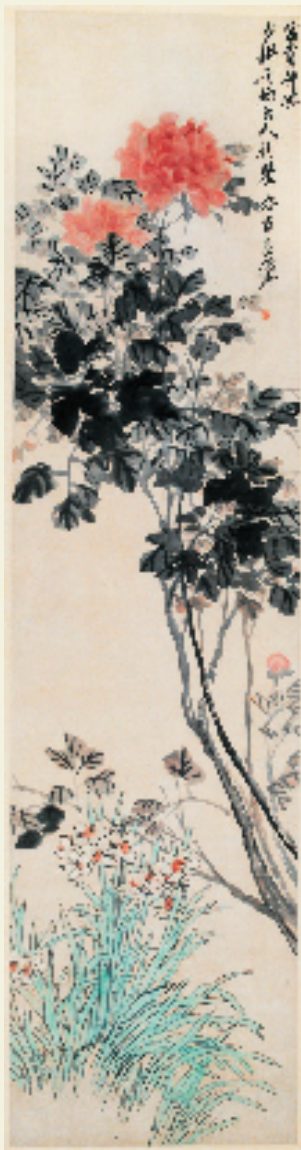
吴昌硕 富贵神仙图 167×42cm 西泠印社藏

吴昌硕定居上海后的16年,构成了他人人生中最辉煌的华彩乐章,被誉为“他的艺术成就,在上海放射出一片耀眼的光芒。”记得当年恩格斯在评述欧洲文艺复兴时曾说过:“这是一个需要巨人而且产生了巨人——在思维能力、热情和性格方面,在多才多艺和常识渊博方面的巨人的时代。”