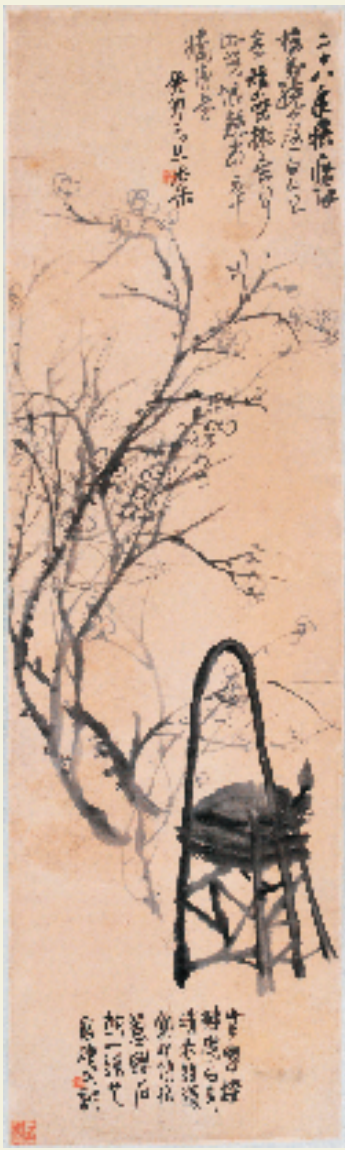
吴昌硕 冷趣图 108.5×32cm 1903年 西泠印社藏