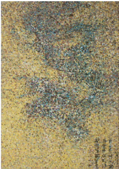
杨冕 CMYK_宋·陈容云龙图 220x155cm

察哈尔学会会长、尚义美术馆信托委员会主席韩方明博士,韩国驻华大使馆公使衔参赞兼韩国文化院院长金辰坤以及两位参展艺术家和来自艺术界、收藏界的艺术同仁共同出席开幕式并参观