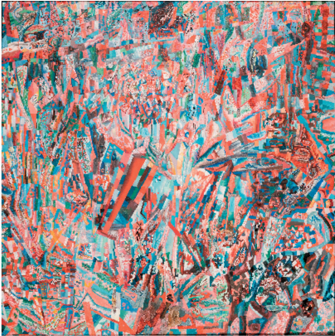
菲洛诺夫 春日公式 1922-1923年