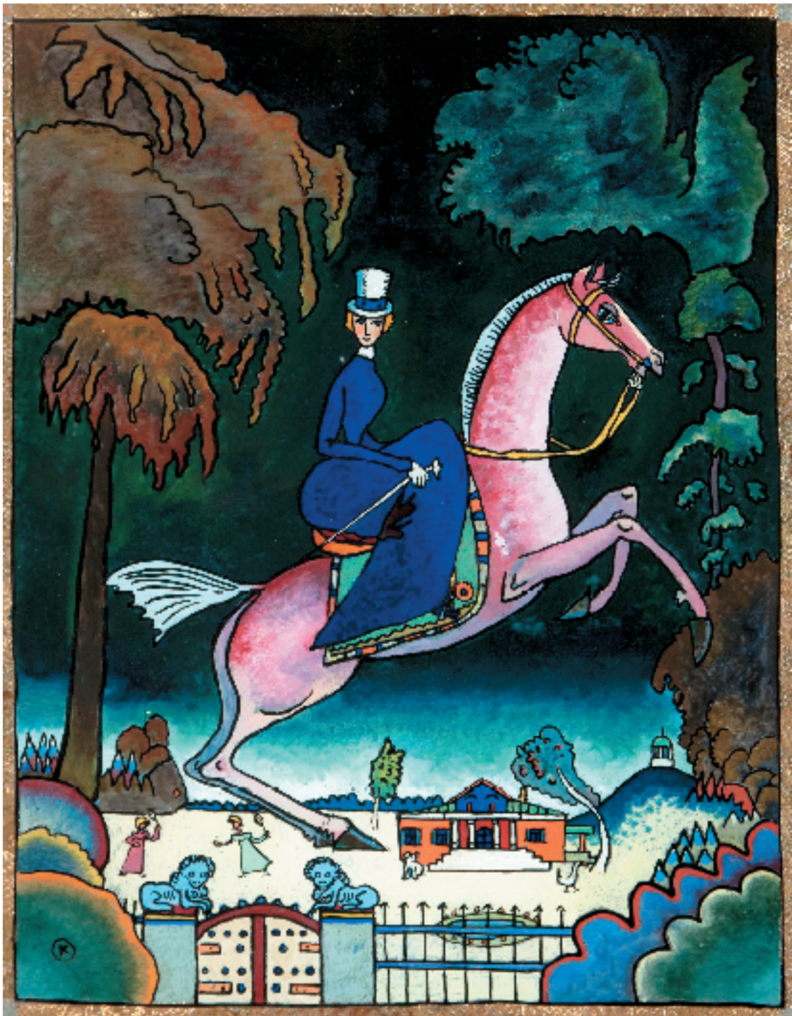
康定斯基 女骑士与蓝狮子 1918年