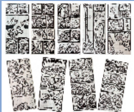
漫画续创系列之穿越恐龙时代