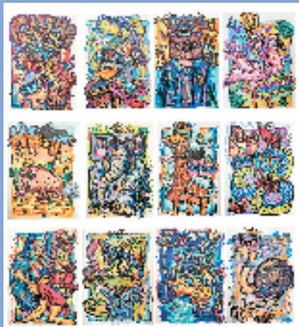
色彩涂鸦系列之动物世界