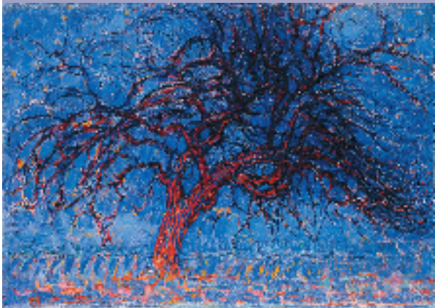
皮特·蒙德里安 红树(1908年)