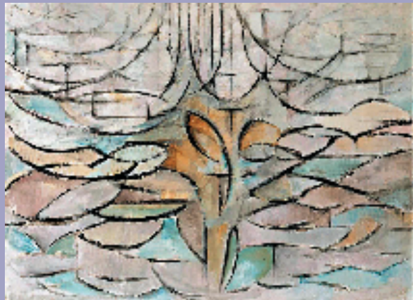
皮特·蒙德里安 开苹果花的树(1912年)