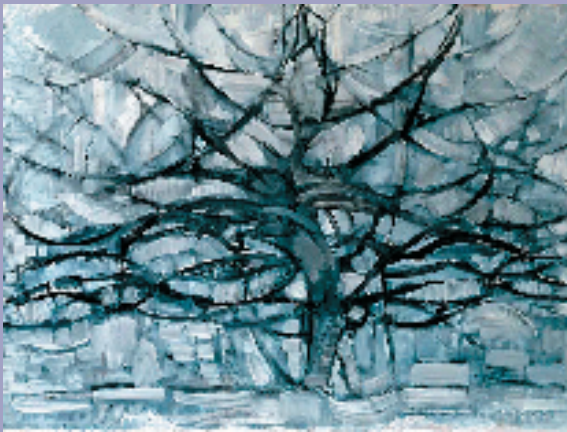
皮特·蒙德里安 灰树(1912年)