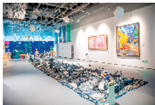
市级展评学生作品在博物馆展出