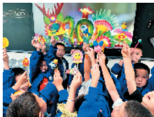
课内导学评价课堂现场

中高年级学生在注重过程性评价的同时又注重对学生结果性的评价,在注重学生全员评价的同时又进行随机抽样性监测评价,丰富评价方式的形式和内容,更全面地了解我市小学生艺术素养的整