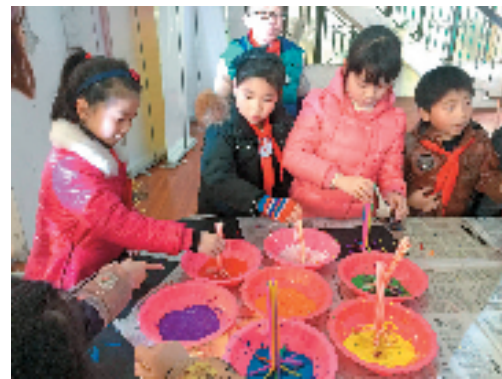
期末学生游园评价现场