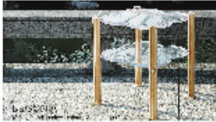
任晓涵 海棠几