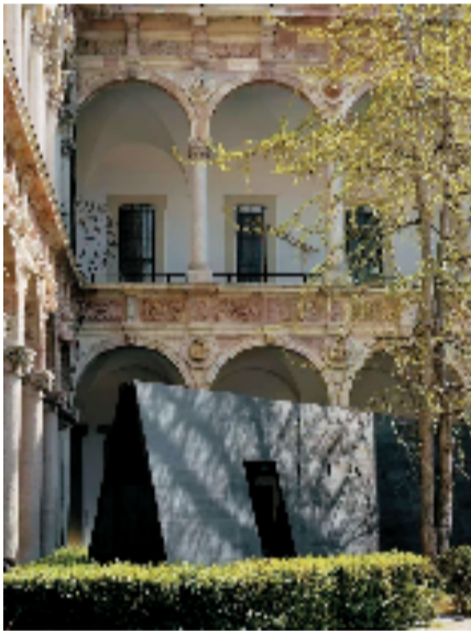
吴滨 杳然庭 装置 版权归 W.DESIGN 无间设计

李加林教授带着自己的三幅作品亮相。其作品运用的数码仿真彩色丝织技术,曾获国家技术发明二等奖,多次入选“国礼”馈赠给外国元首和政要,多件作品被故宫博物院、中国国家博物馆等收藏。此外,王士超、张海德、朱海鹏联合李加林织锦的《阶上椅》,徐乐的《“锁定”系列》,祝爱玉设计的《鹿》手镯,王步超、江黎丽、张艺凡、梁佳铭、叶庆庆的《观境》,张洁菲的《纸上山居》,李可心、秦家培的《IMWOODAI》,Pieces片次方工作室的《“卯合”系列拼装包袋》,林雅洁、代国璇、袁嘉妍的《重组单元》,任晓涵的《海棠