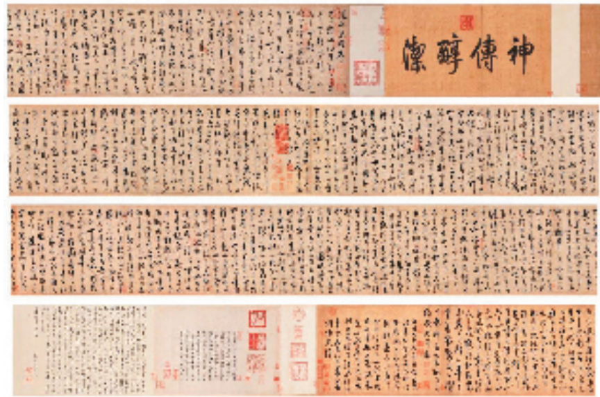
饶介 草书韩愈柳宗元文 藏经纸本 29.8x599.1cm 手卷

本报讯 报艺 香港苏富比中国古代书画部在4月10日共推出两个专场，总成交额达328,165,630港元，成交率达85%，为苏富比古代书画拍卖历来成交额第二高。元末重要书家饶介《草书韩愈柳宗元文》荣膺最高成交拍品，竞投历时逾95分钟，经电话及现场竞投人轮番出价，逾200多口叫价，终以250,100,000港元高价成交，远超拍前估价逾20倍。此作同时创苏富比历来最高价之中国书法作品纪录。 《草书韩愈柳宗元文》展现了饶介在书法艺术上的卓越造诣，以草书形式书写了韩愈的《送孟东野序》和柳宗元的《梓人传》。此卷流传有绪，根据鉴藏印和著录