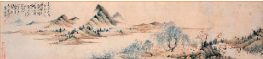
恽寿平 花坞夕阳图 纸本设色手卷 1671年 京都国立博物馆藏

中日文化交流历史悠久、积淀深厚。中国古代汉字、服饰、器物、建筑,乃至宗教、学术、礼制均有东传日本一径,书画亦然;日本近现代科学、政治、文学则对易变之际的中国产生显见影响,余韵悠长。考察两国间文化的交涉、互动与互鉴,有助于打开历史褶皱,重现特定文化现象之源流与微观细节,为理解“东亚文化圈”的形成与演变提供重要参考。正是在此意义上,苏浩、邱吉《中国古代书画在日本的流播研究(1880-1945)》兼顾书画日传整理与研究,于学术补遗之外,为“与古为徒”提供了新视角和新方法。