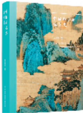
《中国山水画理论史》