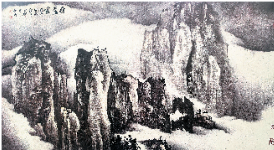
曹文驰 雁荡云 94×180cm 2003年