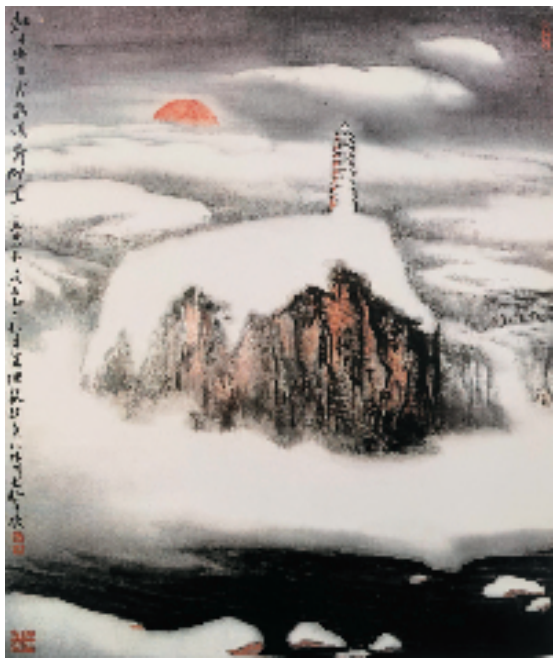
曹文驰 陈毅诗意 95×70cm 1996年