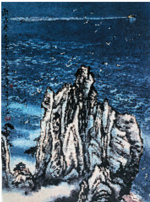
曹文驰 观海亭 96×61cm 1982年