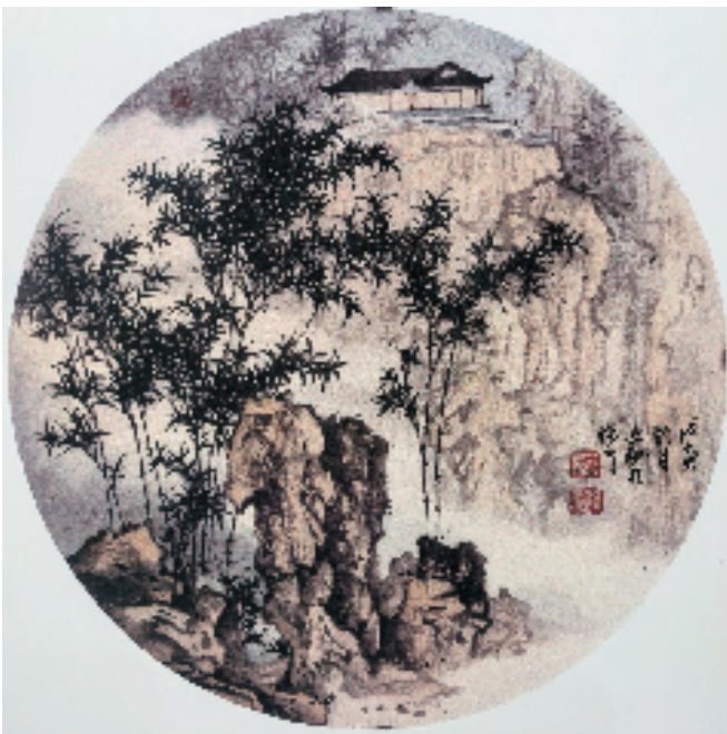
曹文驰 竹园晨曦 直径33cm 1998年