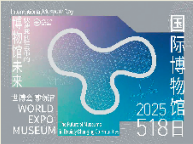
◀ 世博会博物馆根据国际博协提供的素材设计的海报

本报讯 报艺 为庆祝2025年国际博物馆日,世博会博物馆呼应国际博协主题,特别设计了专属阐述海报。世博会博物馆将本次国际博协发布的主题海报中变化的线条与世博会博物馆的云厅造型巧妙结合,同时运用色块营造出俯瞰世博会博物馆的独特视角,展现多彩变换的博物馆宏观角度,呼应本次国际博物馆日主题“快速变化社会中的博物馆未来”。 2025 国际博物馆日主题为“快速变化社会中的博物馆未来”(The Future of Museums in Rapidly Changing Communities),重点强调在快速变化社会中,面对文化身份的守护、创新和重构等新任务,博物馆如何明确自身角色,积极应对各种机遇与挑战,与时代同频共振。