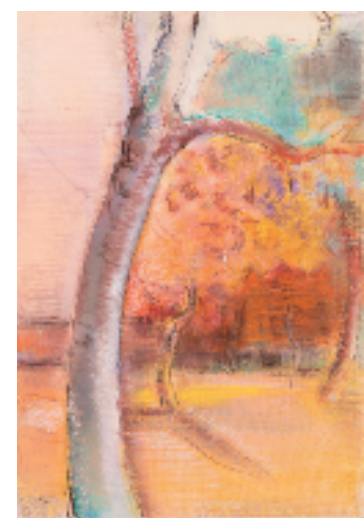
蒋长虹 妖娆 2011年

本次展览分为“当爱绽放时”“充满回忆的家”“沿路的风景”“我的灵魂在歌唱”4个章节,共展出部分捐赠作品121件及文字资料。这些珍贵展品,皆源自蒋长虹遗孀王晓梅女士的慷慨捐赠,她捐出了丈夫生前精心创作的170件粉画作品,为苏州公共文化艺术增添了璀璨珍宝。