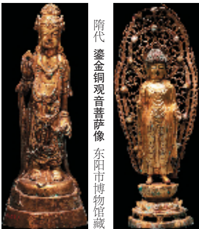
隋代 鎏金铜观音菩萨像 东阳市博物馆藏

佛教自东汉传入浙江,经过近两千年发展演变,融合了中国传统文化,孕育出独树一帜的造像艺术。在历史长河中,浙江地貌丛林遍布,高僧辈出,对外交流频繁,佛教文化底蕴深厚,造像艺术璀璨耀眼。三国西晋时期,越地开始制作装饰佛像的青瓷器和夔凤镜,浙江成为中国佛教传入最早的地区之一。东晋南朝时期,江南地区佛教发展,南朝齐、梁之际开凿的剡县弥勒大佛(今新昌大佛),是中国南方最早最大的石窟造像之一。隋唐时期,两浙地区佛教兴盛,高僧开宗创说,佛教文化艺术影响朝鲜半岛和日本。五代吴越国时期,钱氏诸王尊崇佛教,礼敬高僧,建塔幢、造经像以护佑家国。钱俶效仿古印度阿育王,两次铸造八万四千宝塔,三次大规模刻印《宝篋印陀罗尼经》,天台德韶、永明延寿等高僧大德辅翊王化,以国都杭州为中心的吴越国佛教造像艺术盛极一时。两宋时期,儒家思想和佛教文化相互吸收融合,加速了佛教艺术世俗化和生活化的进程。浙江宋塔出土的各类石刻、泥塑、金银、木雕等造像,体现了这一时代的风气。元代奉行藏传佛教,在南宋故都开凿众多藏传佛教石窟,佛塔地宫亦有藏传佛教造像出土,造像艺术体现了汉藏融合的特点。明清时