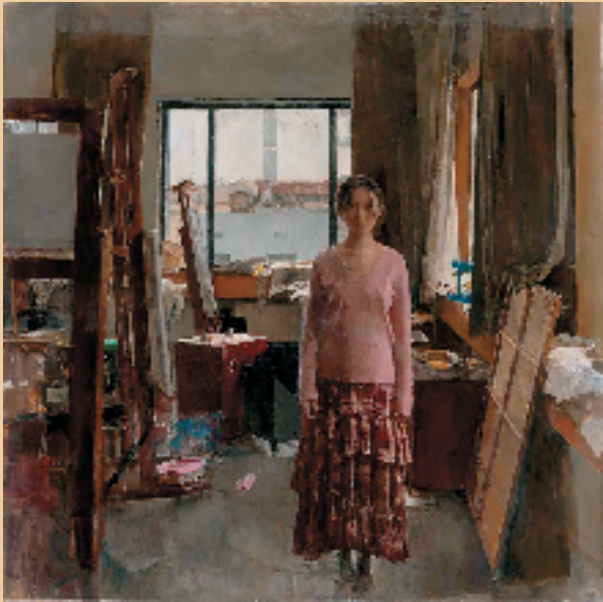
刘宇轩 画室 油画 180x180cm