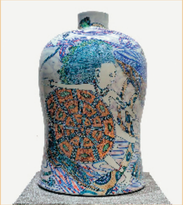
司马周 万物生(其一) 瓷 31x31x51cm