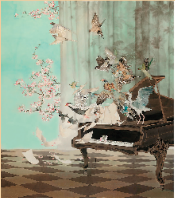
邹德馨 欢乐颂 中国画 240x200cm