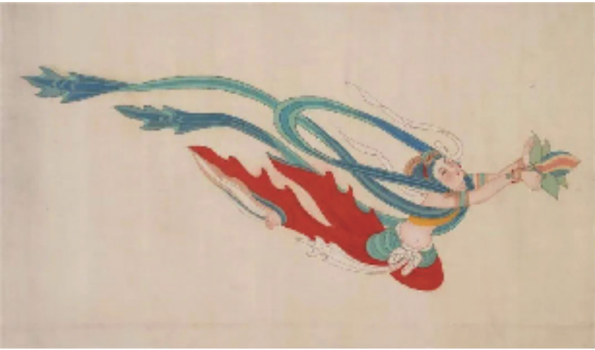
张大千 临摹盛唐飞天图 四川博物院藏

本报讯 成渝 6月18日,“与传统同行——张大千书画艺术展”在重庆中国三峡博物馆展出。