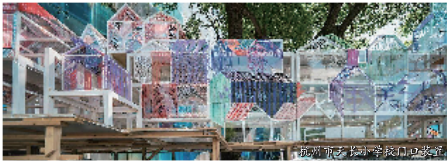
杭州市天长小学校门口装置

还记得电影《我和我的家乡》中亮相的富文乡中心小学吗？这个暑假它以巨型模型的形式矗立在杭州天长小学门口。