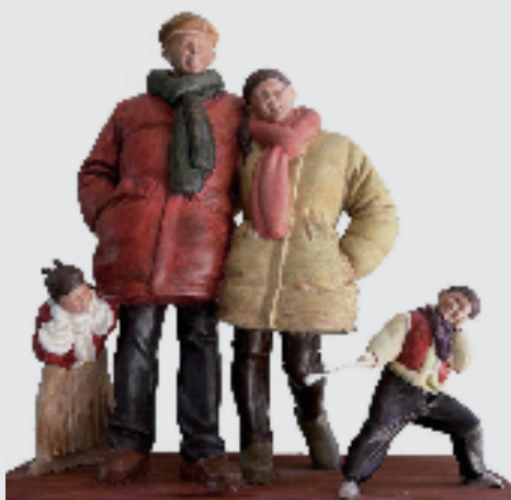
欧阳涛 乐江山 雕塑