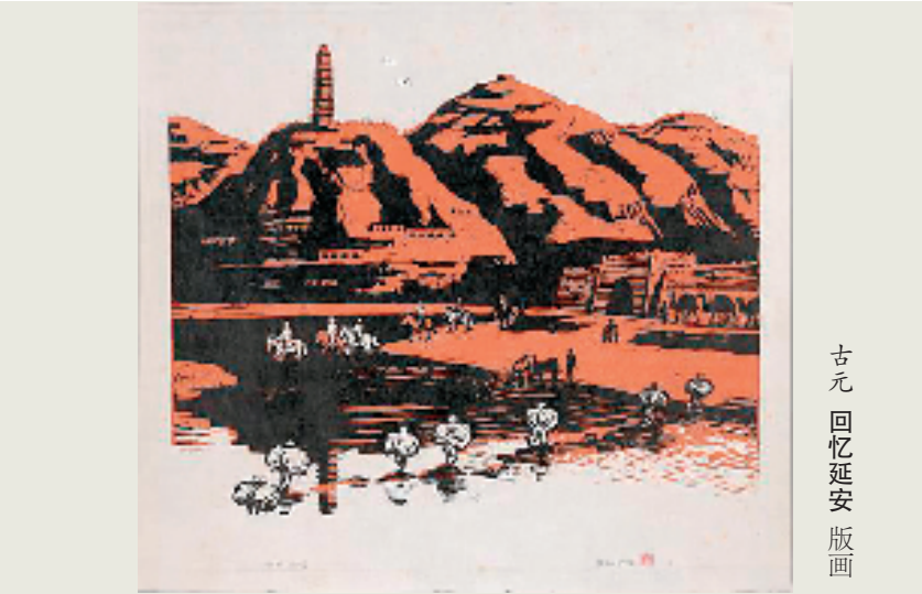
古元 回忆延安 版画

本报讯 记者 厉亦平 2025年是中国人民抗日战争暨世界反法西斯战争胜利80周年,也是孙中山、廖仲恺逝世一百周年。何香凝美术馆联合广东美术馆、浙江美术馆、中国·观澜版画艺术博物馆、连云港市博物馆、珠海市古元美术馆、宁波华茂艺术教育博物馆等六家机构,共同策划“木刻记忆——1931-1945年中国艺术家的视觉实践与媒介传播”专题展,于7月29日在何香凝美术馆开幕。此次展览展出约200件珍贵的木刻作品以及丰富的“抗战图像”,以媒介中的图像为线索,为观众开启一场穿越烽火岁月的木刻史