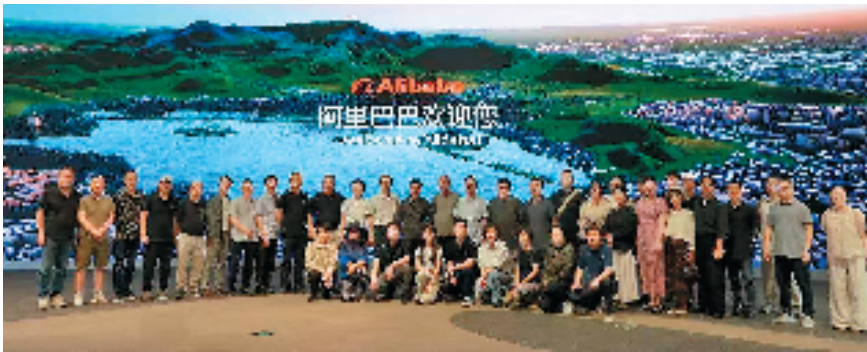
赴杭州科技企业采风合影

“在湖州看见美丽中国。”7月8日,在湖州南浔古镇,白墙黛瓦,建筑疏朗有致,藏有细节。古镇小莲庄以一方莲花池为中心,亭台楼榭环绕。沿百间楼长廊,建筑与水道形成“一河两街”的线性空间,为写生构图提供了天然的纵深