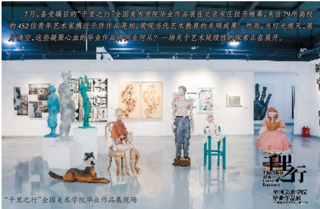
“千里之行”全国美术学院毕业作品展览现场