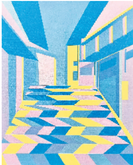
范荣泽(湖北美术学院) 古镇·蓝调 布面丙烯 45×55cm

“千里之行”计划宣布将持续拓展艺术家扶持机制，而“2025重庆当代小幅作品收藏推广计划”也在火热征集中，将继续强化其艺术IP，完善艺术消费市场功能。毕业展的落幕，或许正是艺术生命真正扎根的起点——在美术馆、在市井街角、在产业园区、在寻常百姓家，青春的表达永不落幕。