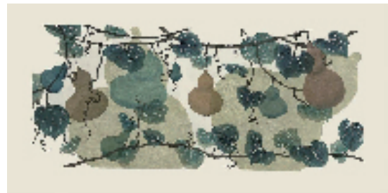
庄咏雯(广州美术学院) 本草图志·葫芦 水印木刻 30×70cm