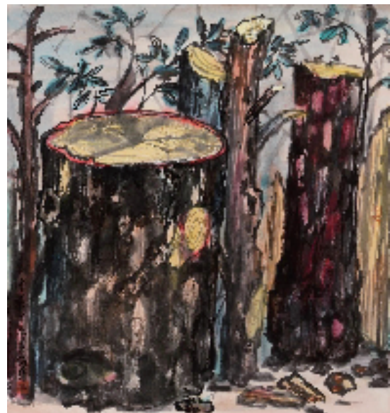
黄格锋(清华大学) 山林木一栋梁 纸本设色 48.5×48.5cm