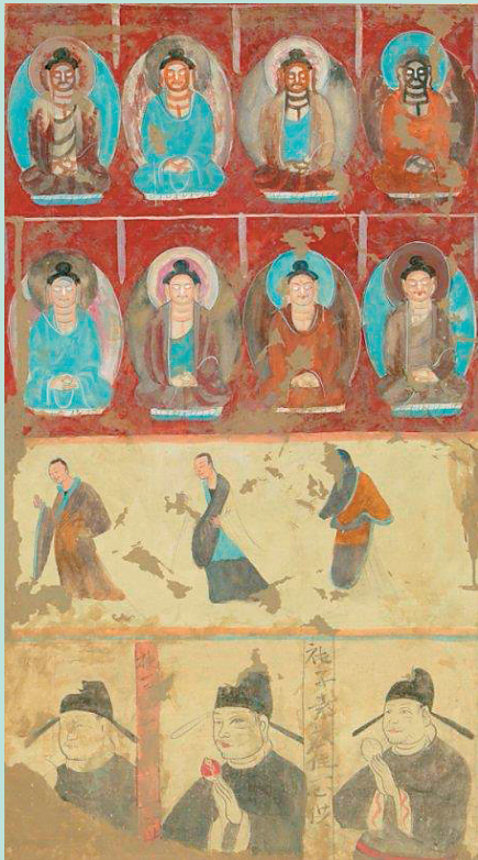
方增先 临摹《莫高窟第263窟千佛与供养人》 95x52.5cm 1954年 中国美术学院藏

8月12日，浙江践行“绿水青山就是金山银山”理念20年系列展在中国美术学院美术馆开幕。本次系列展包含“山水行动”“新媒体影像装置艺术展”“大地之歌·2025美丽中国纪事”“壁路薪传：中国美术学院敦煌艺术藏品及文献研究展”三大主题展览。