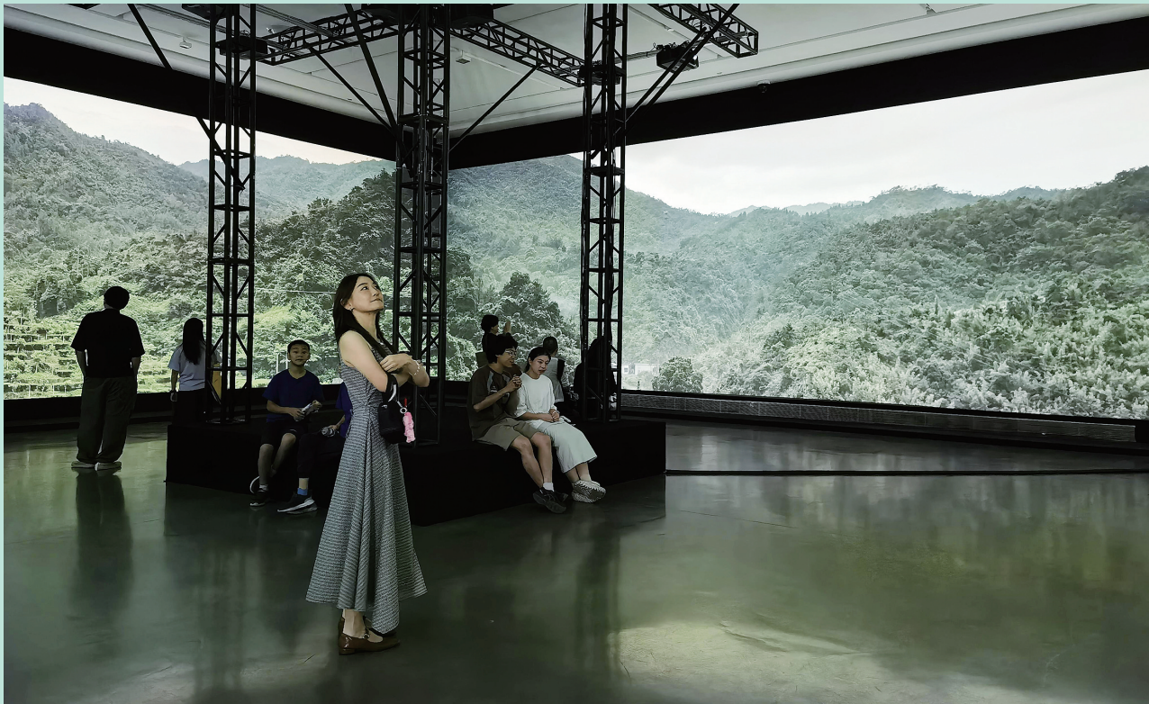
山水行动 新媒体影像装置艺术展