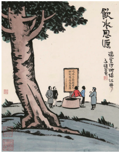
丰子恺 饮水思源 35x28cm 纸本水墨设色 1962年 上海中国画院藏

歌,其漫画作品既有古典诗词的生动阐发,也有现实生活的诗意表达。诗,既是他的创作素材,也是他的艺术本色。丰子恺具有一颗赤子之心,他一生童心未泯,自称是儿童的崇拜者,他以充满热情的画笔赞美儿童的纯洁与天真,批判成人世界的污浊与虚伪;真,既是他的为人之道,也是他的为艺之则。丰子恺具有一颗悲悯之心,他一生悲天悯人,以广大无边的慈悲之怀对待众生与万物,曾作《护生画集》,劝人爱惜生命,戒除残杀,长养仁爱,倡导和平;爱,既是他生命的底色,也是他艺术的基调。丰子恺具有一颗爱国之心,他一生以国为家,抗战时期,他以笔为枪,宣传抗战。和平时期,他以饱含激情之笔歌颂祖国,歌颂人民;国,既是他深爱的热土,也是他永恒的家园。