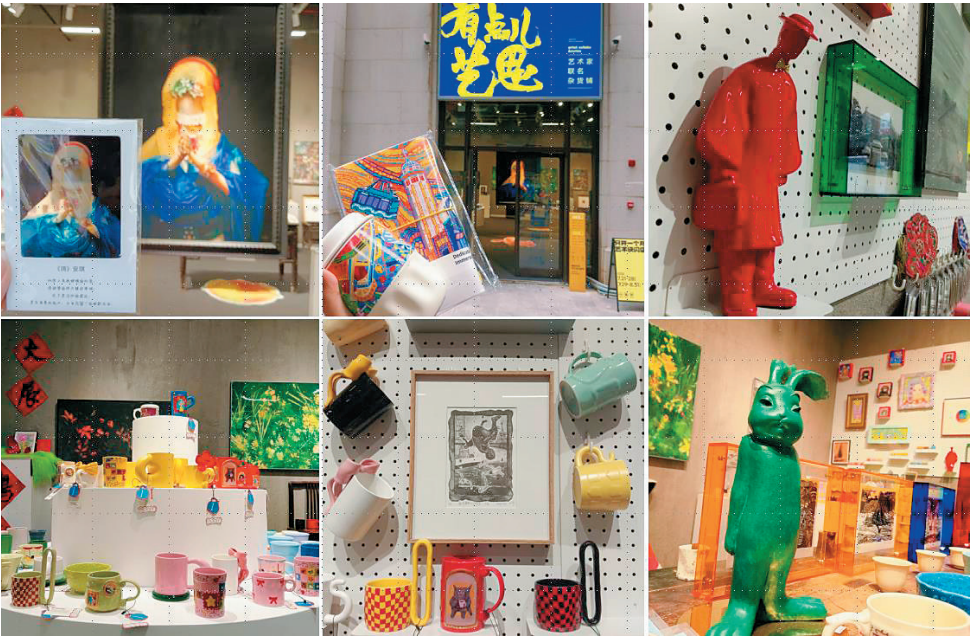
有点儿艺思：艺术家联名杂货铺展示场景

全国各大美术学院的毕业展，仿若一场盛大的艺术狂欢。展厅内灯光璀璨，年轻艺术家们的作品在聚光灯下接受审视与赞叹，每一件都凝聚着数载寒窗的探索与心血。然而当展览落幕、灯光熄灭，这些承载青春梦想的作品便迅速陷入命运的十字路口。 毕业展落幕，毕业作品去哪了？这一话题日前在美术报新媒体平台引发广泛关注。为此本报特别发起问卷调查，并采访了多位毕业生与高校教师，共同探寻毕业作品展后价值再生路径的破局之道。