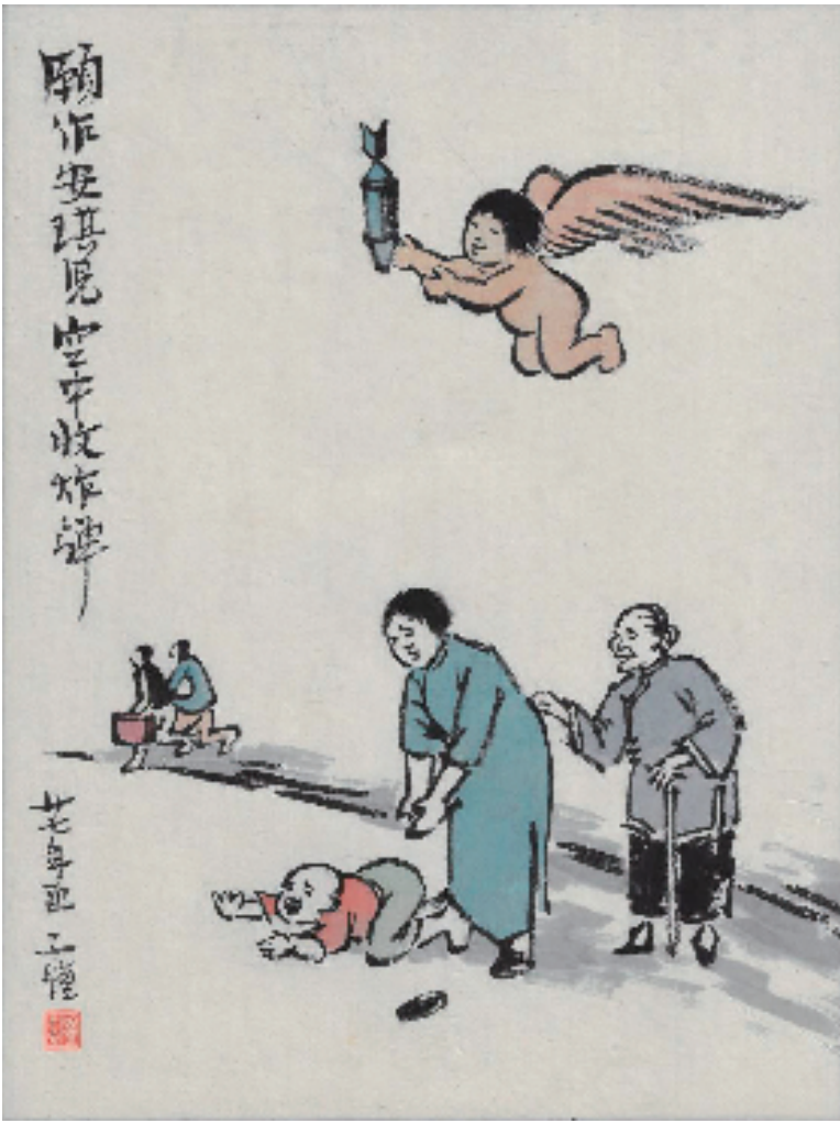
丰子恺 安琪儿 30x23cm 纸本水墨设色

在战火纷飞的年代,漫画家们没有退缩,而是拿起画笔奔赴“战场”,用作品传递抗战士气。1937年7月抗战全面爆发,丁聪21岁,他即刻成为“中华全国漫画界抗敌协会”成员,不但创作了大量的抗战宣传漫画,而且还参与编辑了多种抗日宣传刊物。如《救亡漫画》《战士画刊》《战士画报》以及向国外宣传中国抗日战争的画报《今日中国》等。当时他随张光宇等一批志同道合的师友南下到香港,这是抗战漫画宣传队其中南下的一支,也有像叶浅予、张乐平等入北上到南京、武汉等地的。这一年,丁聪与上海美术界进步人士共同成立上海漫画界救亡协会,将漫画变成抗敌的“轻武器”。