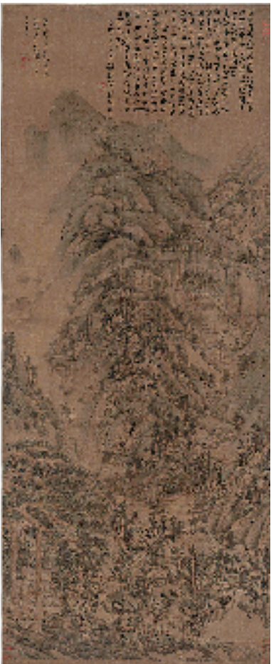
黄公望 天池石壁图

从画面布局看,其犹如一部精心编排的乐章。开篇宁静悠远,如序曲拉开画卷序幕;中间山峦起伏、树木繁茂,此段“热闹”象征着黄公望对自然生机与活力的热烈歌颂,是他经历人生起伏后对生命力量的重新认知与向往,恰似乐章高潮;后半段山水