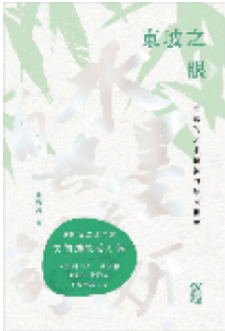
《东坡之眼——苏轼的艺术精神与绘画世界》 金哲为著 上海古籍出版社/出版