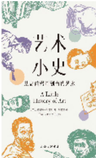
《艺术小史——从史前岩画到当代艺术》 [英]夏洛特·马林斯著 黄格勉译 上海三联书店/出版