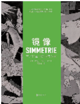
《镜像——艺术作品中的时代对称》 [意]雅各布·韦内齐亚尼著 禹慧敏译 北京联合出版公司/出版