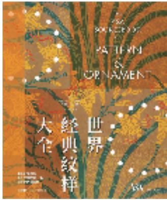
《世界经典纹样大全》 [英]阿梅莉亚·卡尔弗著 张心童译 中信出版集团/出版