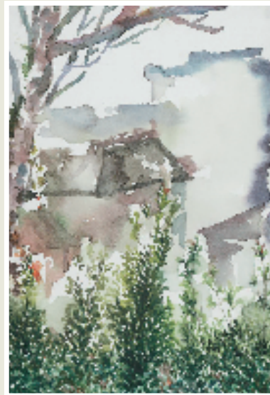
张藻儿 黛瓦白墙 纸本水彩 2024年