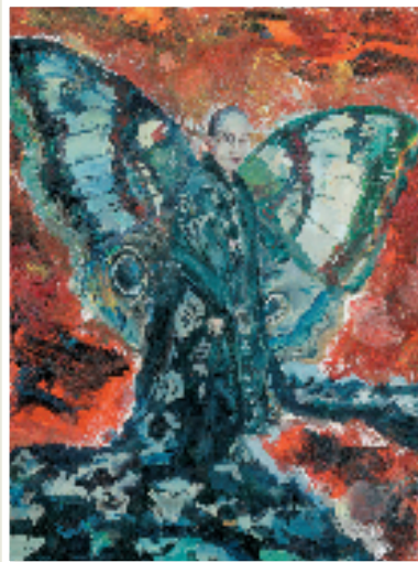
张藻儿 化羽 布面油画 2025年