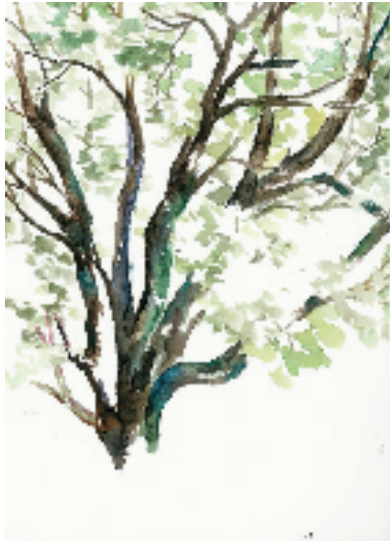
张藻儿 院子里的大树 纸本水彩 2023年