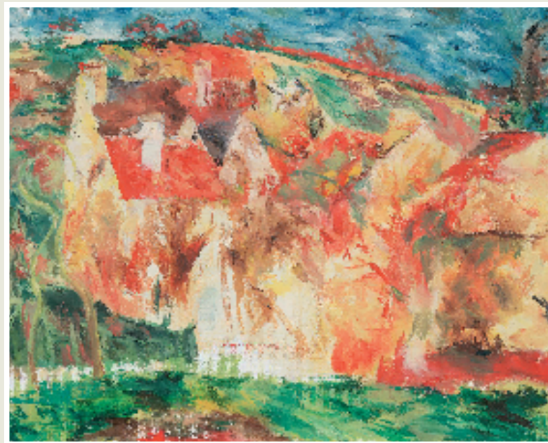
张藻儿 临卡米耶·毕沙罗《红屋顶》布面油画 2025年