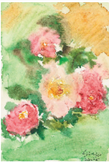
张藻儿 春语 纸本水彩 2022年