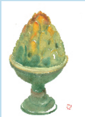
不器之瓷系列 10 10×13.5cm 纸本水彩