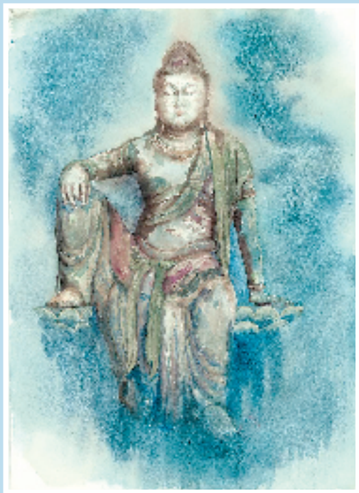
浮云法像 38.5×54.5cm 纸本水彩

她的艺术之旅才刚刚启航, 这份对自然的热爱、对表达的执着, 必将成为她未来成长道路上宝贵的财富。我们相信并期待, 她将继续用画笔, 描绘出更多打动人心的风景与故事。