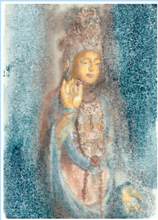
浮云法像 38.5×54.5cm 纸本水彩