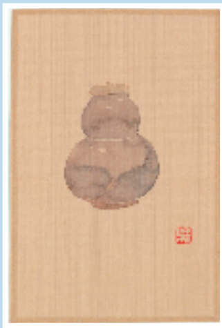
不器之瓷系列 16 10×15cm 绢本