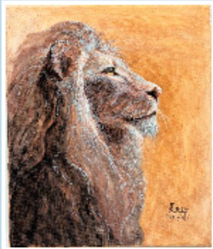
守望之灵 25×30cm 布面油画