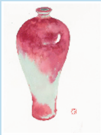
不器之瓷系列 13 10×13.5cm 纸本水彩