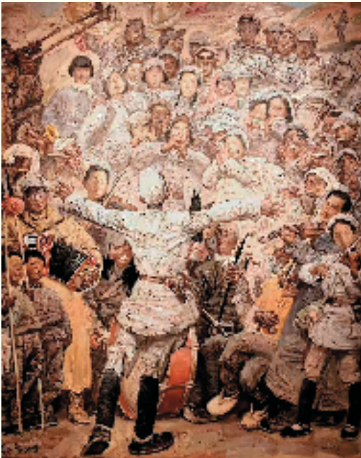
沈尧伊 在太行山上 320×260cm 油画 2008年

王二小,是一个家喻户晓的少年英雄,大家一定早就听说过这个放牛郎的事迹了。13岁的王二小为了保护八路军,把敌人引向了一个悬崖峭壁,献出了自己短暂的一生。这件雕塑作品,刻画了他在敌人面前怒目相视,紧握双拳,绝不肯透露八路军行踪的凛然正气。那头小牛一定是王二小的好朋友,紧紧地贴着小主人,不停地仰望着小主人,给他勇气和力量。王二小牺牲后,艺术家们为他创作了《王二小放牛郎》的歌曲,“把这个动人的故事传扬”。小朋友,让我们怀着对王二小的深深敬意,也为他高歌一曲吧!