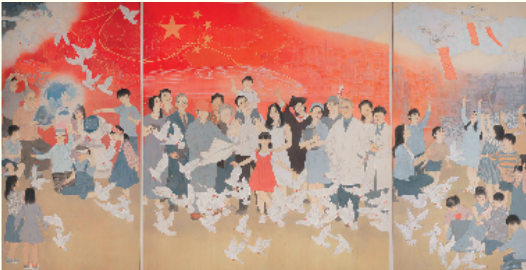
张琳、杨可 放飞梦想 180×390cm 中国画 2019年 中国美术馆藏

这幅作品以清新的色彩,描绘了各条战线上的英雄人物,科技精英,还有我们的小朋友们在画面上一字排开,欢聚一堂。画家精心设计了他们的服装色彩,两边人物以灰色为主,中间的人物以白、黑和红色为主,有一种鲜明的对比,在五星红旗辉映下,很自然地成为了画面的中心。他们正在为实现中国梦而忘我地学习和工作着。作者以极大的热情对小朋友们寄予了期望。看,画面上有那么多的小朋友:左边的小朋友正在探索的是人工智能,宇宙的奇观。右边的孩子们放飞的是对未来的梦想。无数的鸽子在围绕他们飞来飞去,让画面增添了祥和、温馨的氛围,和谐号的身影把我们引向了时代的前列,经历了抗日战争胜利的中国人民,正在经历着中华民族伟大复兴,巍然屹立在东方!