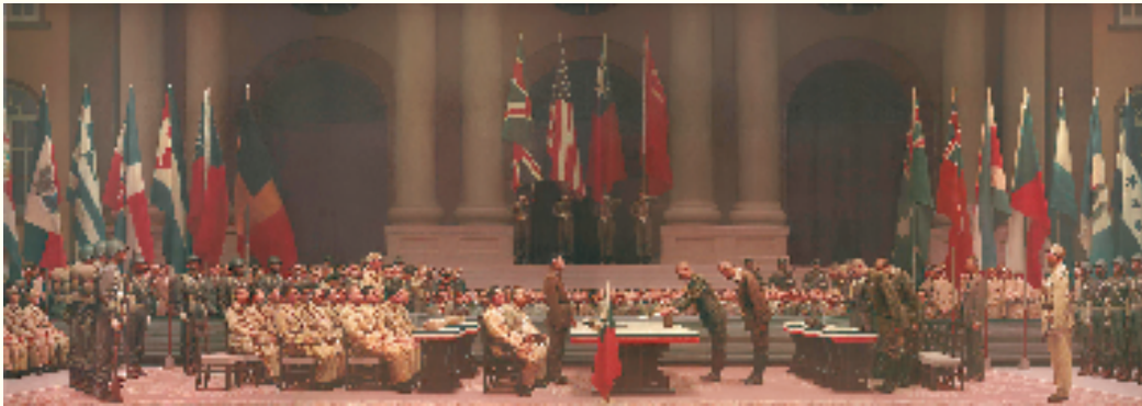
陈坚 公元一千九百四十五年九月九日九时 220×600cm 油画 2004年 中国美术馆藏

1945年9月9日上午9时,在南京中国陆军总司令部举行了中国战区日本投降签字仪式,结束了日寇对我国长达14年的侵略,也宣告了抗战的胜利,这是中国人民永远值得纪念的重大事件。巨幅的油画作品就生动地记录了这历史性的庄严一刻,作品采用了对称式构图,场面宏大,真实地再现了日寇狼狈不堪的丑态。作品中插满了反法西斯国家的国旗,突出了司令部里高大的柱式,让它们隐没在灯光阴影中,略带幽暗的光线加强了画面的威严、庄重的气势,这也是作品创作成功的重要因素之一。