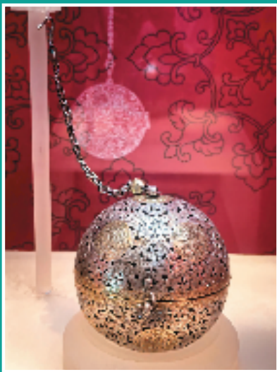
博物馆里展示的大香球