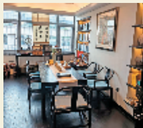
现代茶室里放香炉