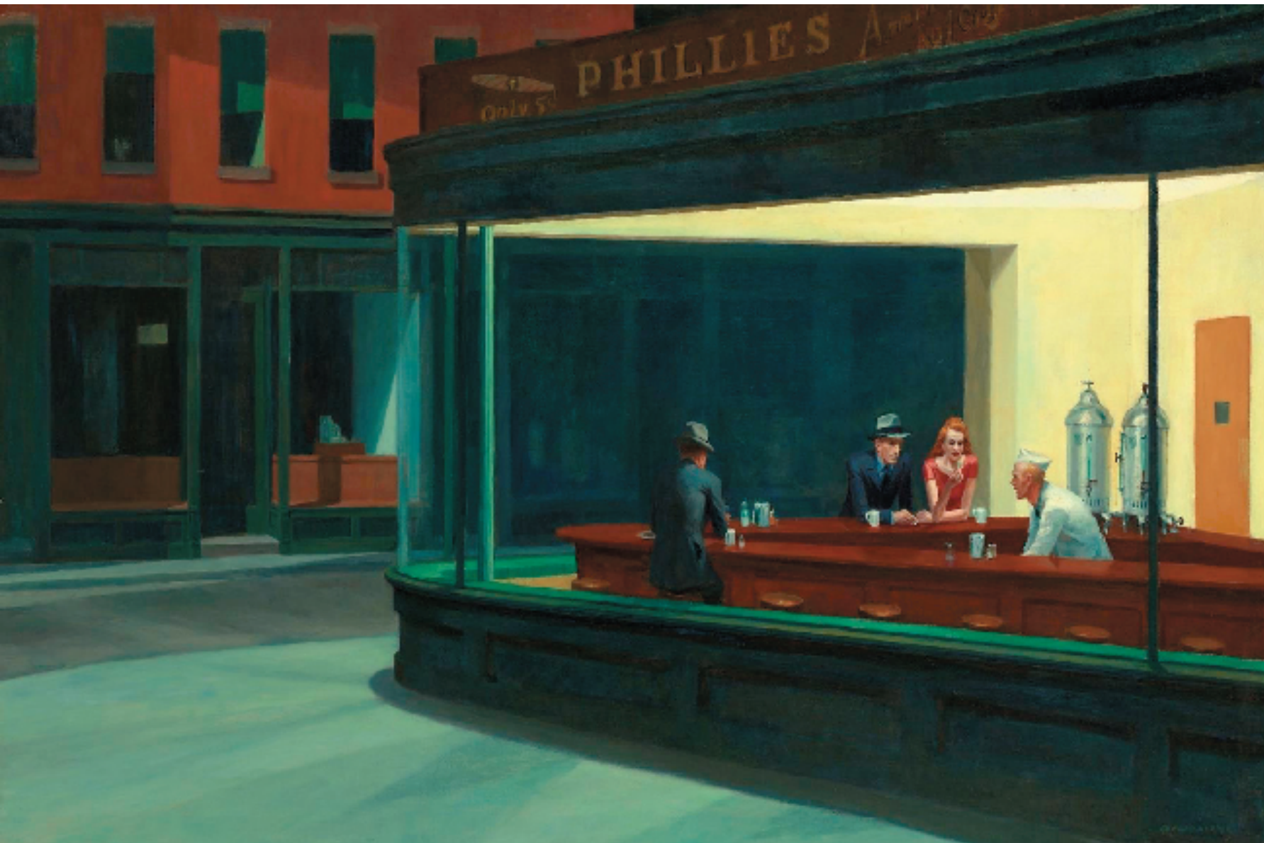
爱德华·霍珀 夜鹰 布面油画 1942年 芝加哥艺术博物馆藏