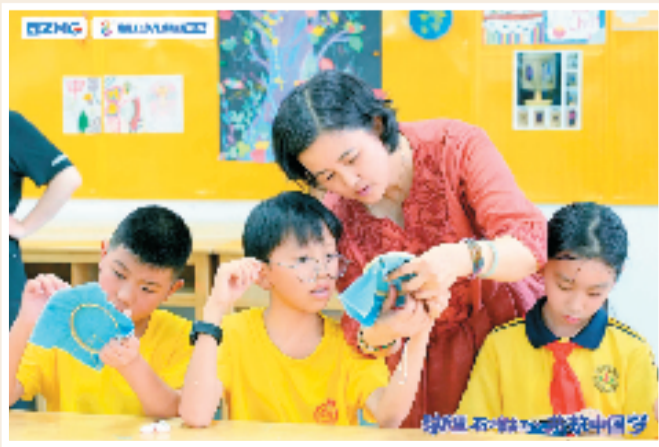
教师指导学生刺绣创作