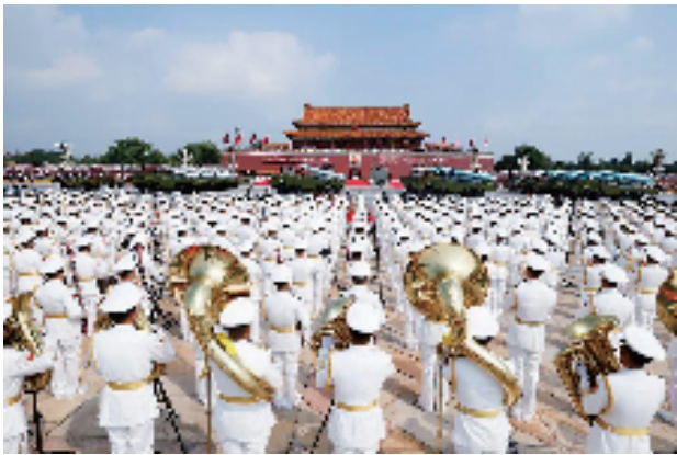
反舰导弹方队接受检阅。