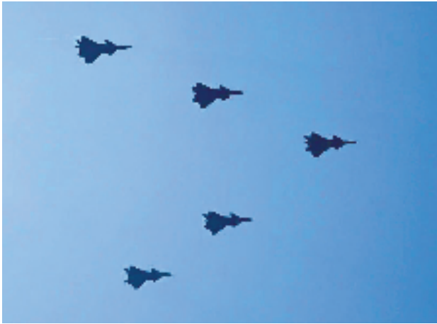
“歼-20家族”再添新成员歼-20S亮相阅兵场。