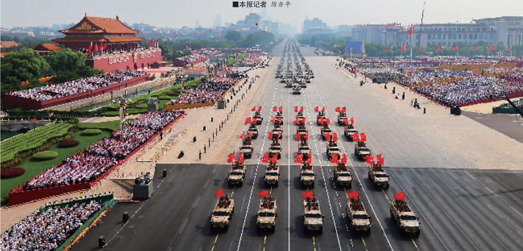
战旗方队和装备方队接受检阅。

9月3日上午，纪念中国人民抗日战争暨世界反法西斯战争胜利80周年阅兵仪式在北京天安门广场盛大举行。这不仅是对往昔峥嵘岁月的深情回望，更是一场汇聚艺术审美与独特设计的视觉盛典。