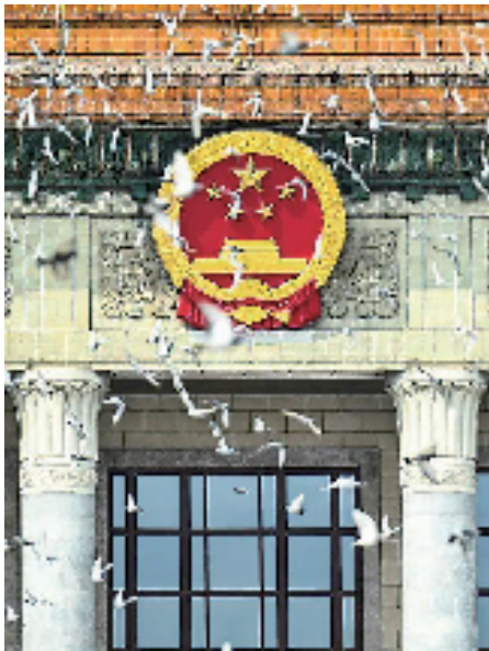
纪念大会现场放飞鸽子。