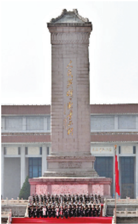
国旗护卫队从人民英雄纪念碑基座出发，走向旗杆基座。

这场阅兵仪式，以独特的设计和精妙的构思，将历史的厚重、文化的底蕴与军事的力量熔铸为艺术的丰碑。当“三人为众”的观礼台托起万众目光，当城墙红与橄榄绿交织出和平底色，当长城纹与和平鸽共同诉说民族风骨——这不仅是一场视觉的盛宴，更是一次精神的洗礼。它让历史的荣光在当下闪耀，让和平的信念在人心扎根，更让世界看见一个民族从抗争走向复兴的磅礴力量，这份震撼与感动，终将镌刻在每个中国人的记忆深处，化作续写时代华章的无尽动力。