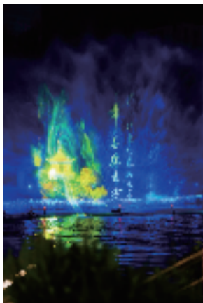
《如梦上塘》节日限定水幕