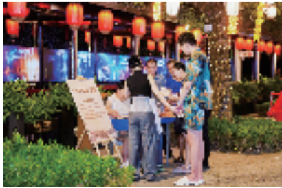
游客参与游园打卡活动