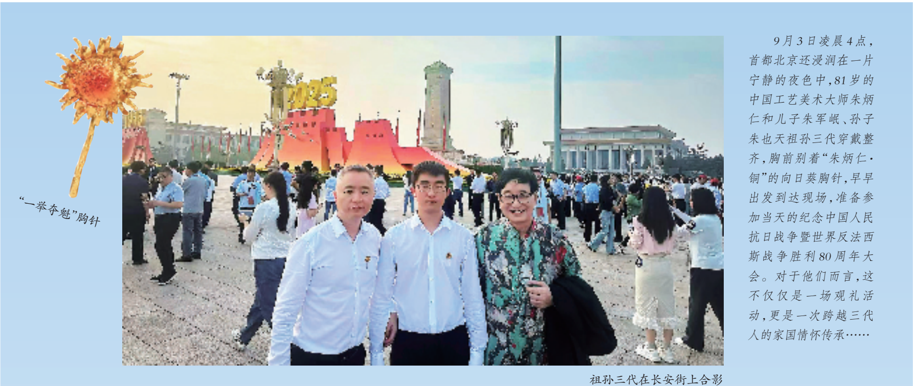
祖孙三代在长安街上合影