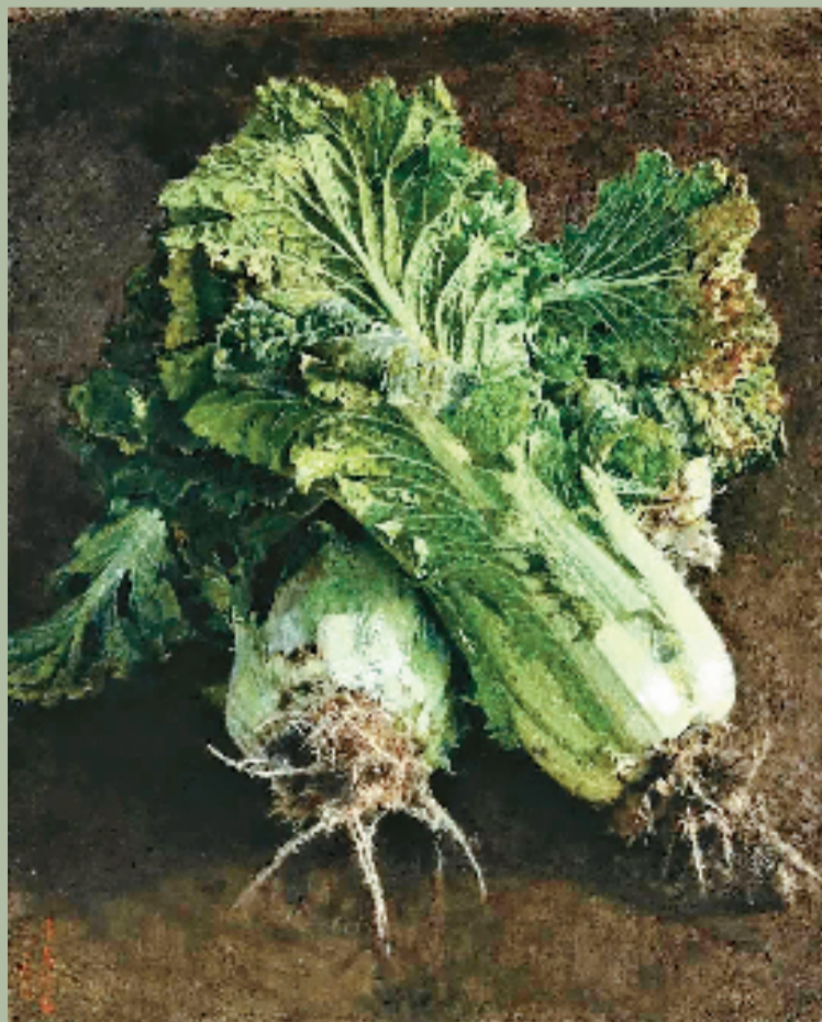
曹春生 白菜 油画

赖跃森,是网络上比较活跃的一位画家,喜欢分享自己的创作。其笔下的写实画作,一颗颗“白菜”不仅是普通的蔬菜,更像是一件件精美的艺术品,每一笔都充满了对生活的热爱与敬意,每一画都凝聚着画家的匠心独运。层层渲染的色层之下,不仅是对自然之美的颂歌,更是对劳动人民辛勤付出的致敬。(左下图)画面中的这颗白菜栩栩如生,每一片叶子都清晰可辨,纹理、层次井然有序,丝毫没有杂乱的痕迹。色彩搭配淡雅之中透出生动,仿佛能够引领人置身于那片绿意盎然的田野,亲身体验那新鲜的菜香。作品以小鸡、昆虫和白菜组合,又似乎在诉说着美妙的田园故事。