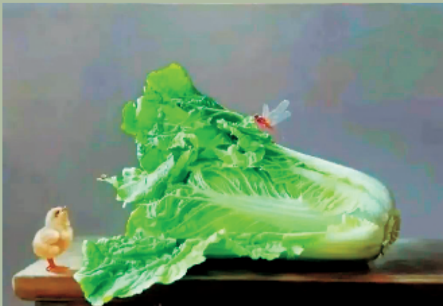
赖跃森 初见 油画