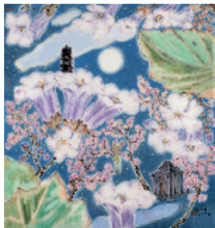
徐冬青 燕园景明 86x76cm 纸本设色 2025年

表示：“徐冬青从日常生活中寻找美感，将生命体验融入艺术创作，在追求中国画诗意特质的同时，呈现自我独一无二的个性风格。艺术的意义莫过于此。”