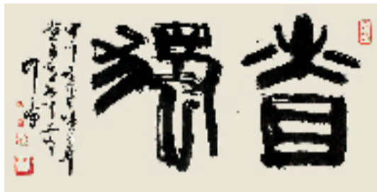
韩天衡 慎独轴 35×68cm 立轴 2015年

中国书法兰亭奖迄今已经举办了八届,推出了一大批书法名家。获奖者既有书坛耆宿,也不乏青年俊彦。此次巡展集中展示了第四至第八届中国书法兰亭奖的159件获奖精品,作品涵盖篆、隶、楷、行、草、篆刻多种书体,风格多样,技艺精湛,既深植传统