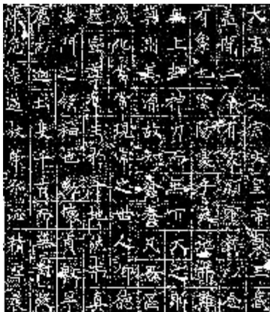
同州三藏圣教序碑(局部) 103.5×216.5cm

书法的功能演变和道法精进源自人类求新求变的永恒特点,虽受限于朝代更迭的意识形态,但依然凝结现实人文的审美追求,呈现出艺术在地理、道