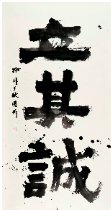
赵冷月 立其诚 243x122cm

展览旨在正本清源,引导大众回归经典,提高书法审美水平。临摹,是学习书法篆刻的必由之路,是与古代大师对话的桥梁。通过临摹经典碑帖,我们可以汲取古人的智慧和技巧,感受传统书法篆刻艺术