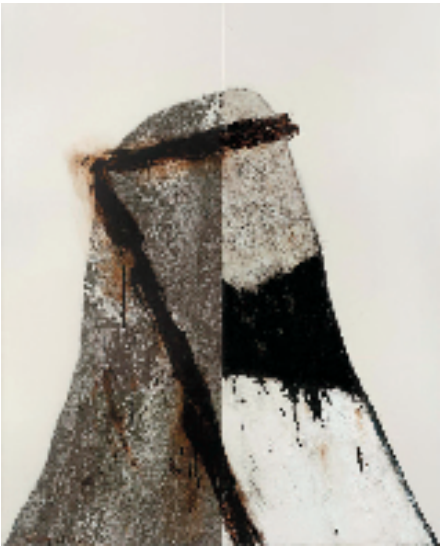
尚扬 董其昌计划-45 360×290cm 布面综合材料