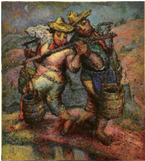
罗中立 故乡组画-接力 200×180cm 布面油画