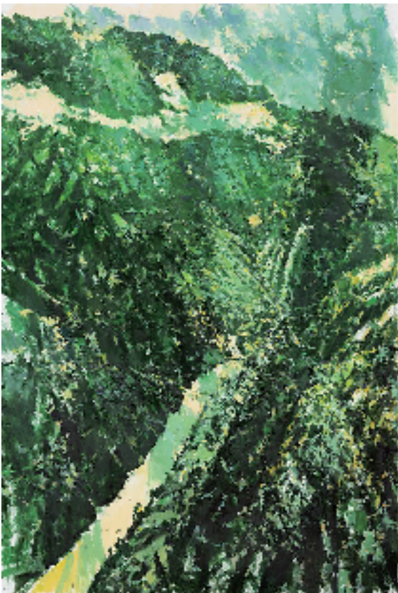
许江 关于远山的迷宫·峡 230×160cm 布面油画

作为对詹先生讲话的继承与响应,我在那次理事会换届的致辞中,强调当代绘画的三重使命:第一重使命,在视觉文化的整体视域中,重建绘画的力量。第二重使命,在中西文化交流的视域中,重构中国油画的形象。第三重使命,在大众化的文化生态研究的视域中,重塑绘画的信心和责任。进而,我又提出中国油画的“时代三神”:第一,回到绘画本身,重建本土艺术的深度精神。第二,重视绘画之象的建构,聚焦绘画方法论的建设。第三,深入艺术创作的心性特征,呼唤艺术的诗性精神。纵览学会的发展,坚守绘画本体,重塑中国文化精神;厚积时代生活的体验,锤炼人民的形象和人民精神;倾心绘画语言的深耕,呼唤艺术的诗性精神,这“三神”,在三十年的风雨兼程中,缛淬化,磨炼厚积,始终是自觉自立的核心文