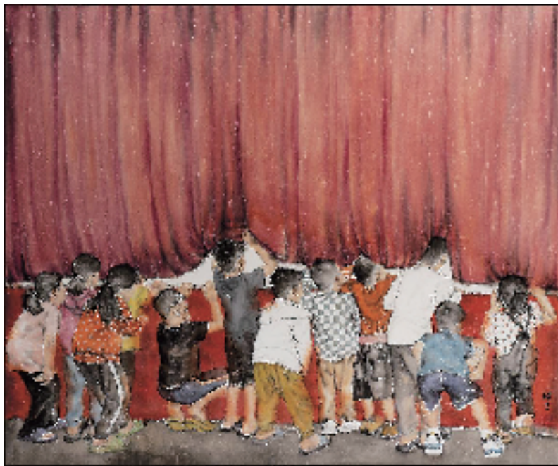
梁醒生 玫瑰红色的回忆 190×230cm 纸本设色

本报讯 林晓峰 9月12日，由广州美术学院和深圳市关山月美术馆主办、广州美术学院中国画学院承办的“小天地——梁醒生人物画展”在深圳关山月美术馆举办开幕式。本次展览展出作品76幅，共分为四个策展单元，分别为“童蒙之态”“旧雨新知”“主题叙事”和“浮生世相”，集中呈现了梁醒生最近五年的艺术创作成果，是画家艺术探索历程的一次阶段性总结。开展以来受到艺术界与市民的欢迎，主办方将展览延期至9月21日。