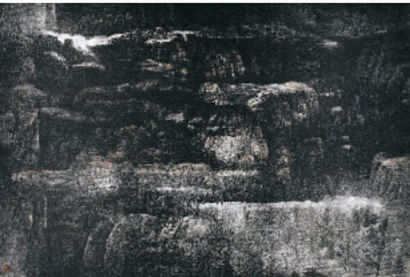
朱敏 往事如烟——太行山兵工厂 240×370cm

本报讯 董娜 9月19日至10月19日，上海中国画院主办的“海上名家研究系列·闲梦远山——朱敏绘画作品展”在上海中国画院程十发美术馆展出。本次展览呈现艺术家朱敏20世纪80年代末至2025年跨度超越30年的山水画作品70余件。他在多年深入行山之中看山，几经创变，绘就一系列墨色披靡、生机磅礴的水墨巨作，更将个人对远山的深沉体悟化作寄情笔端的一场闲梦，带领观众一起步入他所创造的山水宇宙。