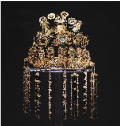
流金点翠嵌宝“诰命”龙凤冠

展览以中国目前最早的金饰为切入点,展出三星堆、金沙、武王墩、燕下都、海昏侯、何家村、法门寺、江口沉银、明定陵等全国重要遗址的精品文物。这些金银器不仅承载了中华民族的礼仪、信仰与审美,同时更深深烙印了中华文明的古老印记。每一道纹饰,每一处细节,都澎湃着民族的创造力与自信力。它们的熠熠光辉,是古老智慧与时代华章的碰撞,彰显了民族的气度,也昭示着磅礴的气韵。