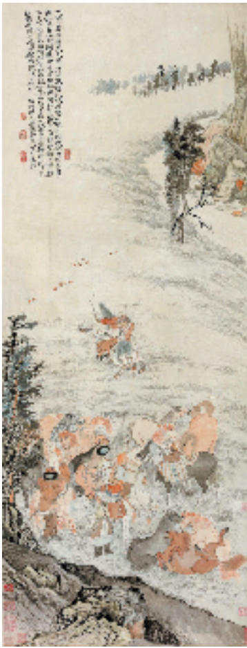
石涛 番人秋猎图 161x60cm 立轴 成交价3450万元 上海嘉禾春季拍卖