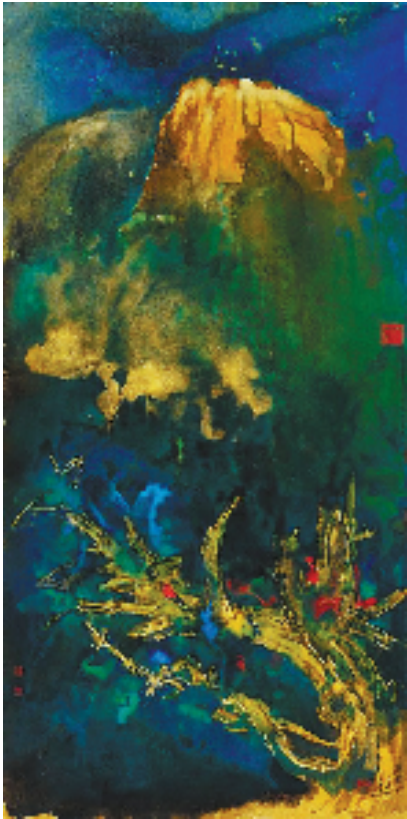
中国嘉德2025年春拍推出的张大千《日蚀》以7935万元成为本季度最高价拍品

2025年上半年,政府有关部门加快推进文物保护法实施条例等法规规章修订,推进市场线上线下一体化管理,加强市场执法检查和案件办理,优化文物艺术品流通领域管理服务。行业协会加强行业自律监督,开展文物经营活动管理研究,举办论坛搭建对话交流平台,推动市场创新发展。拍卖企业线上交易成为常态,丰富传播方式拓展和培育新客户,企业品牌效应凸显,丰富业务类型、开展多方合作、推动业态融合,加强学术价值挖掘和市场引领,履行文化传承和传播使命。