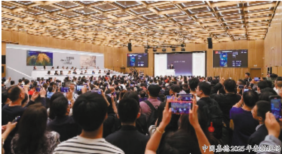
中国嘉德2025年春拍现场

本报讯 报艺 国庆节前,中国拍卖行业协会艺委会在第六届艺术市场·北京论坛上发布了《2025年春拍全国十三家文物艺术品拍卖公司评述》。本次评述以中国嘉德、中贸圣佳、西泠拍卖、北京保利、上海嘉禾、华艺国际、北京永乐、广东崇正、上海匡时、北京银座、上海朵云轩、北京翰海、北京荣宝(按公布成交额排序)13家拍卖公司为样本,通过对其公布的数据进行统计分析,以反映2025年春拍全国文物艺术品拍卖市场基本情况及趋势。本评述系赵榆先生自1995年创发并定期发布至今。本次评述由赵榆指导,刘聪、王耀萍主笔。