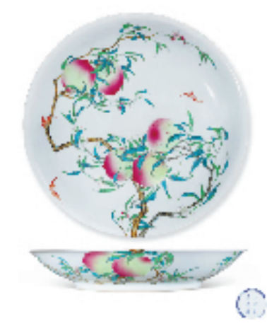
清雍正 粉彩过枝“福寿双全”八桃五蝠大盘 直径50.5cm 成交价4255万元 北京保利春季拍卖