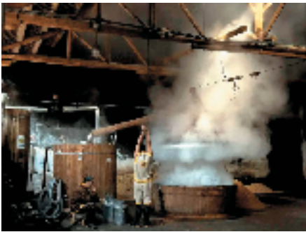
迈克尔·弗里曼 坊中酒香

迈克尔·弗里曼毕业于牛津大学,接受过经典的长篇社论式图片报道训练,作品常见于《史密森尼杂志》《时代生活》《地理》等国际顶级媒体,是当代最具影响力的视觉叙事者之一,被誉为“摄影师的第一导师”。其出版摄影著作逾 160 本,被译为 28 种语言全球发行。从茶马古道的马帮到上