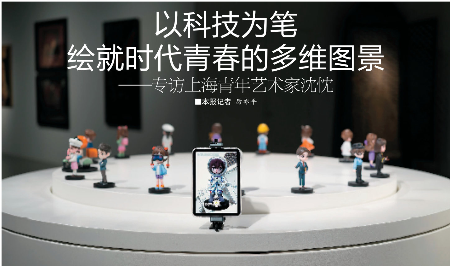
沈忱 时代青春 AR 交互装置 2025 年