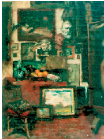
吴作人 画室内（巴思夫画室）布面油画 1934年

本报讯 记者 黄俊娴 11月3日，“桂冠金奖”吴作人比利时岁月作品与文献系列展开展见面会于苏州吴作人艺术馆举行。据悉，该展览入选文化和旅游部2025年全国美术馆青年策展人扶持计划提名项目。本次展览由苏州市公共文化中心、吴作人国际美术基金会主办，吴作人艺术馆承办，苏州市名人馆协办，中央美术学院、浙江美术馆支持。 20世纪30年代，吴作人从巴黎转赴比利时布鲁塞尔皇家美术学院深造。本次展览展出的百余件文献与作品，正是这段历史的珍贵注脚。 泛黄的手稿、工整的课堂笔记、习作中的炭笔线条，以及那件象征求学硕果，并被授予桂冠生称号的油画作品《男人体》，共同勾勒出一位年轻艺术家在异国文化中的攀登轨迹。尤为难得的是，这些跨越近一个世纪的资料历经战火与动荡，仍能幸存至今，使得我们窥见早期中国留学生在接受西方教育时的思维路径：既有对技法与制度的虔诚吸纳，亦有以东方视角对异质文化的审慎抉择。 据此次展览的策展人、苏州市公共文化中心吴作人艺术馆副馆长陶懿霞介绍，该展览系吴作人比利时岁月作品与